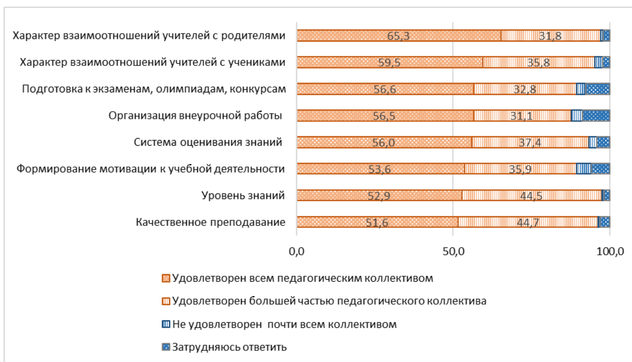
Рис. 2. Оценка родителями профессиональной подготовки и социально-коммуникативной компетентности школьных учителей, 2019 г., %

Перед каждым родителем, отправляющим в школу своего ребенка, стоит сложнейшая задача – выбор образовательного учреждения, которое бы отвечало основным запросам семьи: качественное образование, высокий уровень профессиональной подготовки школьных учителей и их социально-коммуникативная компетентность, эффективный информационный обмен и взаимодействие.