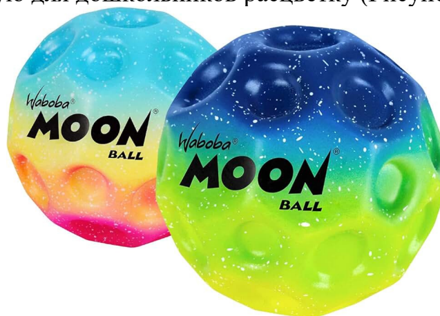
Рис.1. Moon ball, или «лунный» мяч

В отличие от обычного каучукового мяча мун болл обладает особой поверхностью, похожей на поверхность Луны с ее кратерами, которая обеспечивает ребенку приятные тактильные ощущения, тем самым позволяя снять эмоциональное напряжение. Также «лунный» мяч, как правило, имеет яркую, привлекательную для дошкольников расцветку (Рисунок 1).