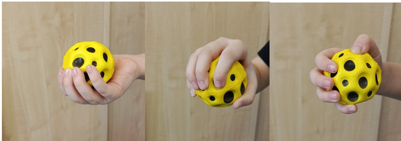
Рис. 2. Варианты захвата мяча

Работу с «лунным» мячом так же, как и с обычным каучуковым, начинаем с освоения техники захвата. Выделяют три вида захвата мяча: «ковш», «обезьянка», и «стаканчик» (Рисунок 2).